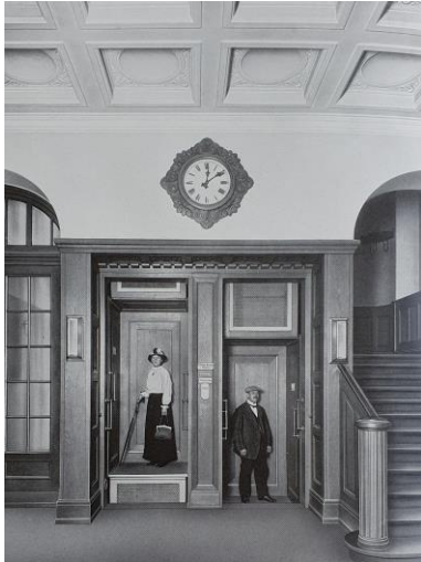
Katalogbild Fa. ATG Paternoster bei der Fa. Teubner, Leipzig, 1922